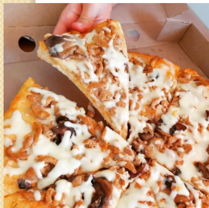
Точка быстрого питания «Зебра»