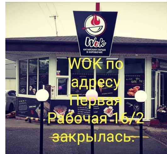
Тоска быстрого питания WOK