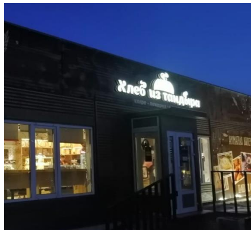
Кафе ресторан «Хлеб из тандыра»